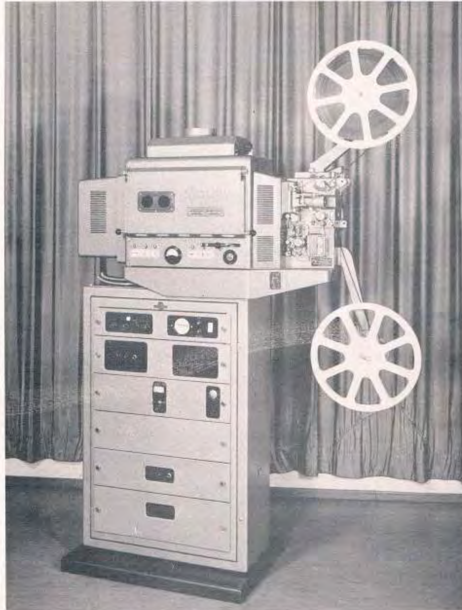
Tonfilmprojektor für 16-mm-Schmalfilm Typ BAUER-SELECTON-II-0, auf Siemens-Verstärkergestell Bauart Fernsehen