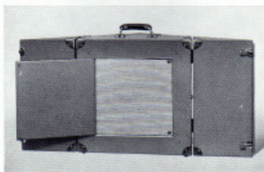
15-W-Kofferlautsprecher zum Projektor »2000«

Separate Klangfarben-Regulierung für Höhen und Tiefen.