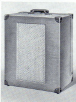
2 x 6-W-Kofferlautsprecher zum Projektor »2000«

Tonwiedergabe durch dynamischen Hochleistungs-Kofferlautsprecher.